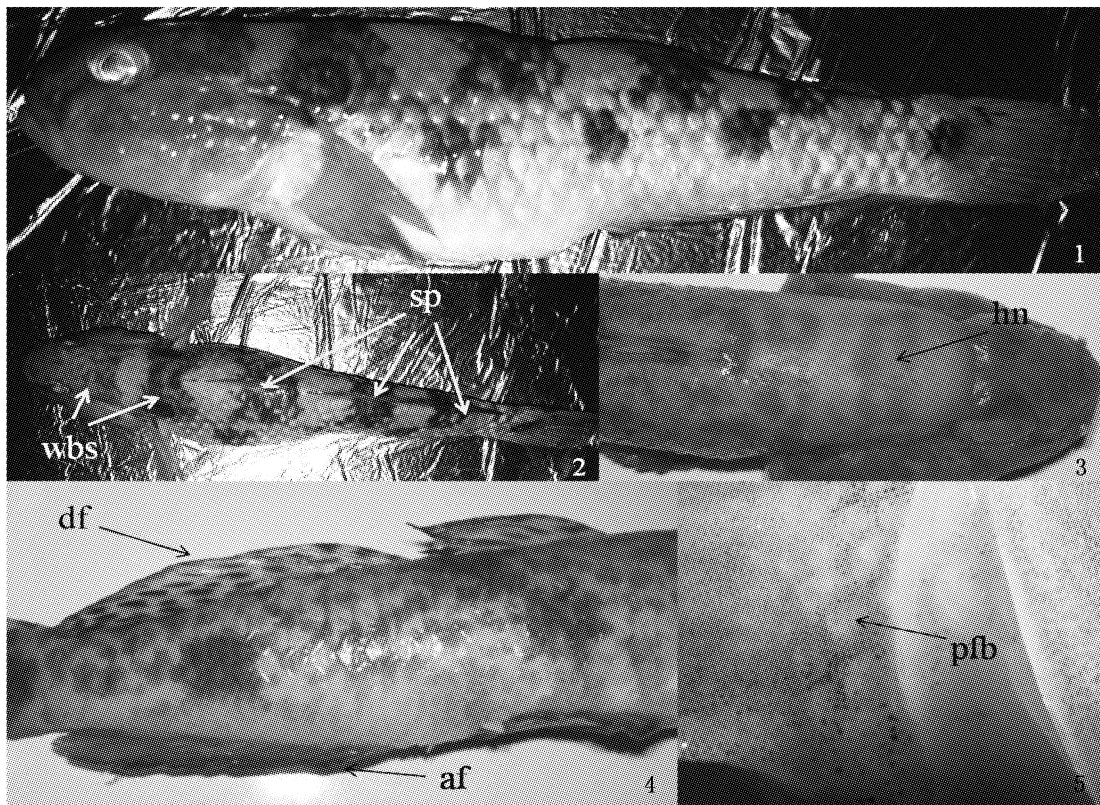
图版 所采集的云斑裸颊虾虎鱼的外形图