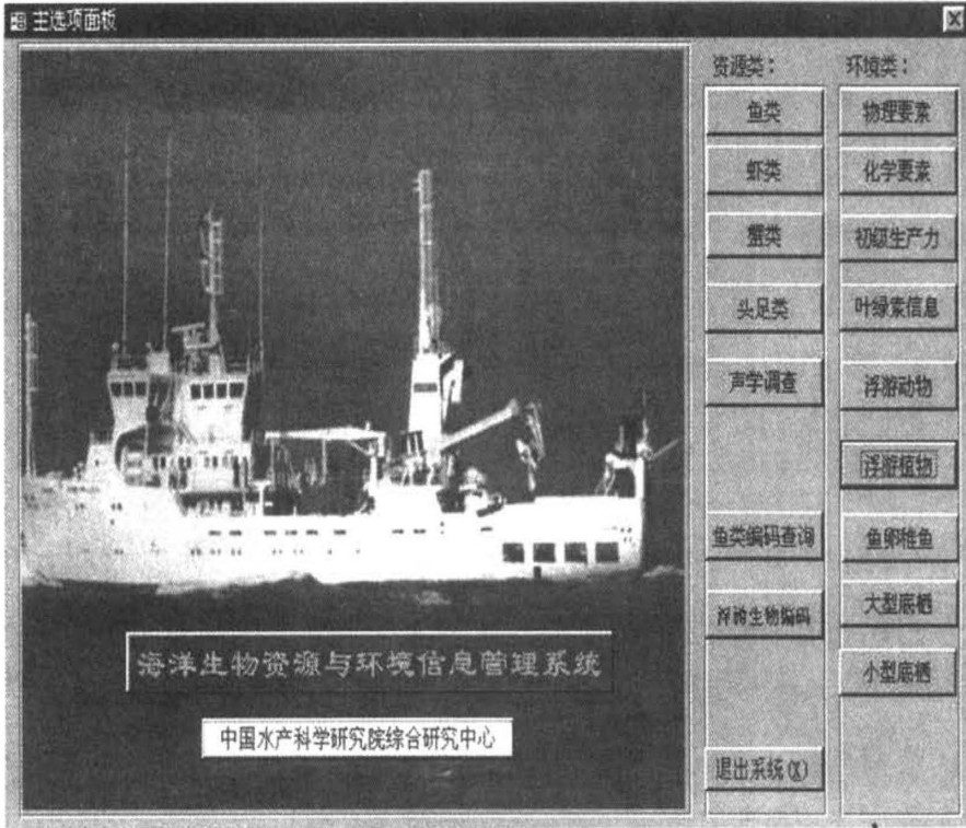
图 2 主窗体