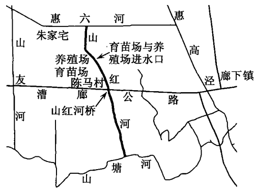
图 1 山红河地理位置

河道为南北走向,南接山塘河,北接惠六河。山红河长 2.1 km,宽 25 ~ 42 m,深度 2.5 ~ 3.1 m,平均深度 2.7 m。惠六河通过其他支流与黄浦江相通,故山红河具半日潮汐变化特点。因山红河为当地农业灌溉和水产育苗与养殖的重要水源,可知当地农业与水产业的开展与山红河水质状况密切相关。但据有关资料报道 [1-2] ,近几年来,全国地表水均程度不等地遭受了污染,且属中度污染,一些河流持续呈现富营养化 [3] 。山红河也不例外,但尚无见有关该河水质的调查报告,本文通过对山红河廊下镇河段水质全年状况的连续监测,获得该河段全年水质变化状况及其特点,并据此对该河段的水质状况进行初步评价。调查与分析所得结果可为该地区开展农业生产,特别是为养殖业育苗和养成用水的净化处理提供科学依据,也可为当地水环境治理与上海市河道保护提供可靠资料。